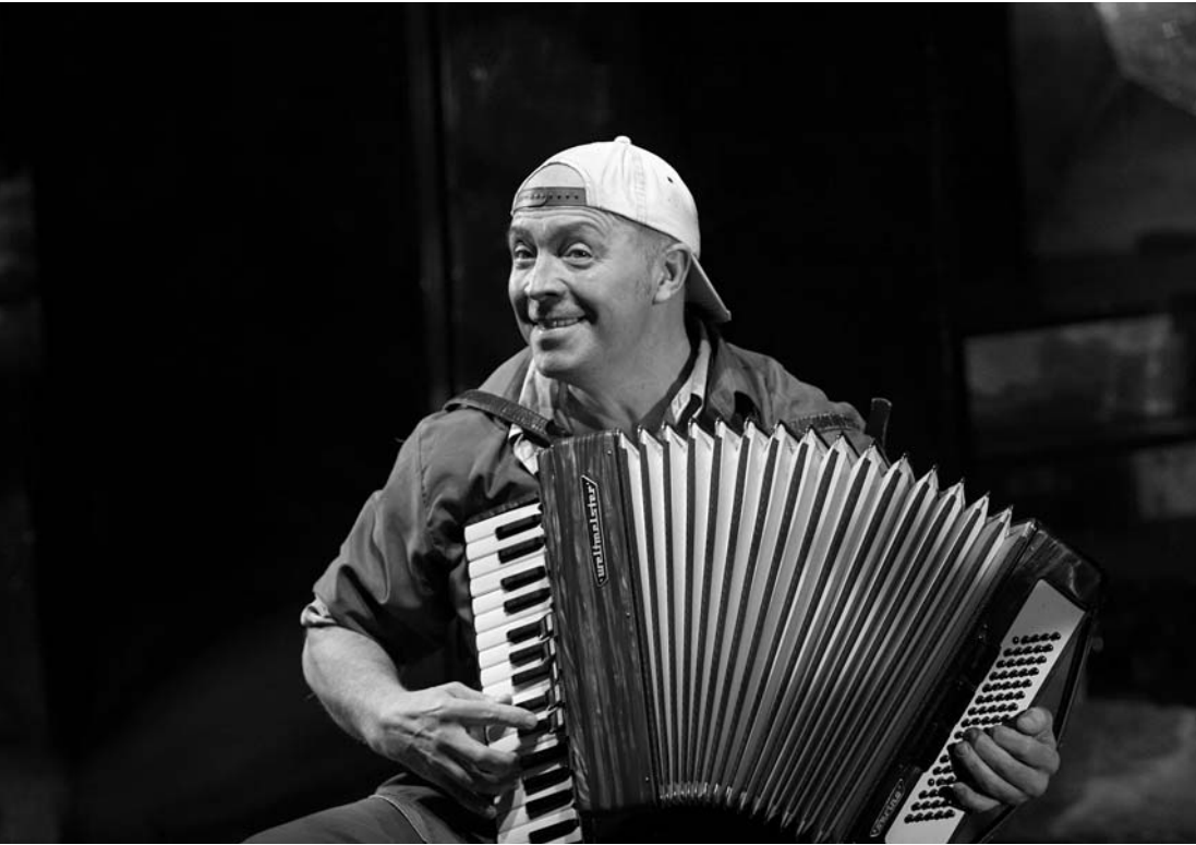
Валерий Белякович в спектакле «Моно». Фото из книги «Братство белого ключа» Н.Д. Старосельской

ранова » — знаменитое повествование о его матери (передавшей сыну свой неистовый нрав). «Клавдия Баранова — это ведь все равно, что Анна Каренина!» — считал сын. Карина читает этот текст по-своему, с присущей ей изящной улыбкой. Но ведь и невозможно повторить исходную авторскую интонацию. Его, Беляковича, азарт, авантюризм и блеск повторить все равно нельзя, и каждый кладет собственную краску на этот уникальный грунт.