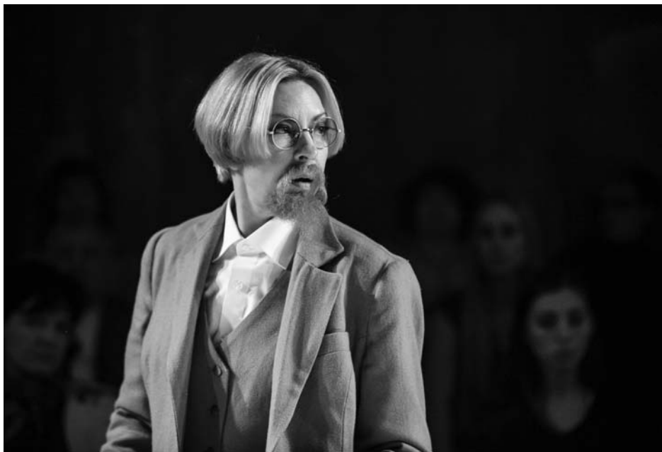
«Событие». Опаяшина — С. Кухарь