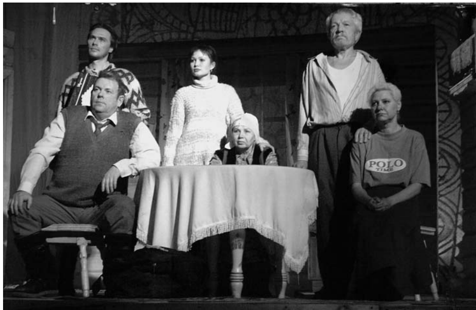
«Семейный портрет с дензнаками»

тиру, чтобы увезти туда возлюбленную, он пишет ей нежные письма. И это признание самой молодой героини пьесы, человека, которого родные и неродные считали доверчивой, житейски неопытной, вдруг поражает их своей мудростью: как могут рядом с чистыми, святыми чувствами жить злоба, неприязнь, отчужденность людей?