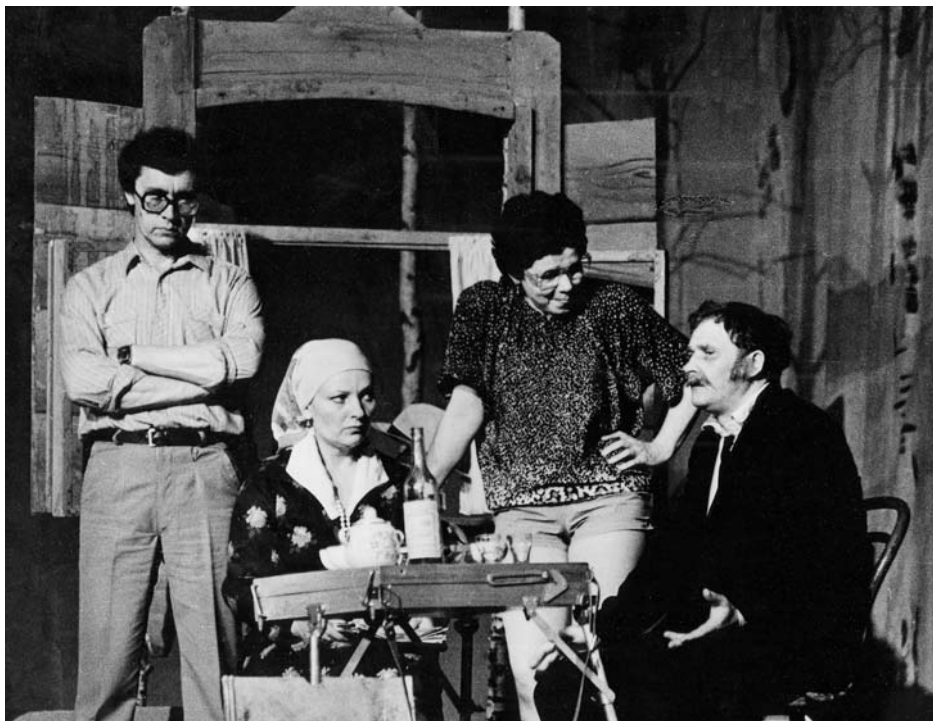
«Маленький спектакль на лоне природы»

боты до воскресения» (1988), «Коммерсанты» (1990), «Семейный портрет с посторонним» (1991). К тому времени он получил серьезную профессиональную подготовку. Степан Лукич окончил в Москве Высшие режиссерские курсы, театральные курсы при Институте театрального искусства имени А.В. Луначарского, двухгодичные творческие курсы при Литературном институте имени М. Горького. За пьесу «По соседству мы живем» он получает в 1987 году Государственную премию Бурятской АССР, в том же году становится лауреатом премии «Дебют года», присуждаемой журналом «Театральная жизнь», в следующем – лауреатом Всесоюзного конкурса молодых драматургов. Спектакли по комедиям нашего земляка поставили ведущие московские и ленинградские театры, сценические коллек-