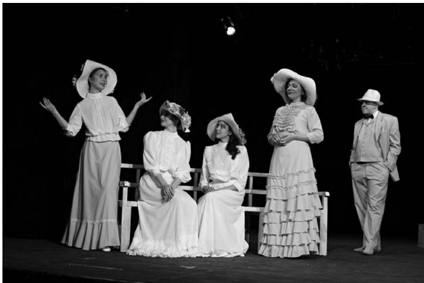
«Первая любовь». Театр «Камерная сцена», Самара