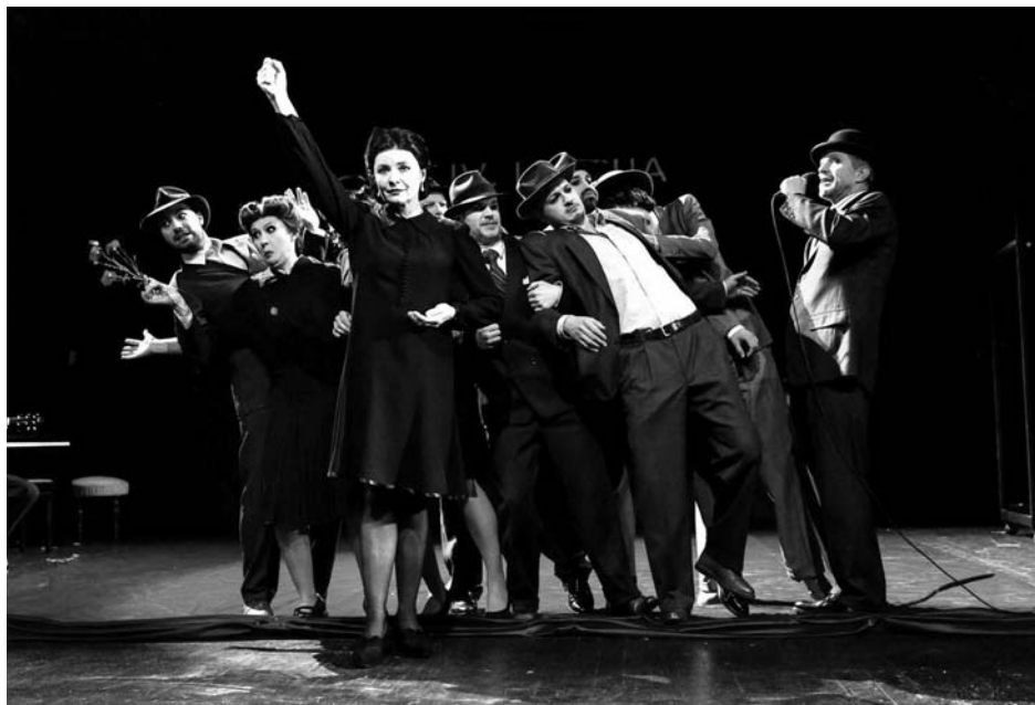
«Наш класс. 14 уроков истории», Словения