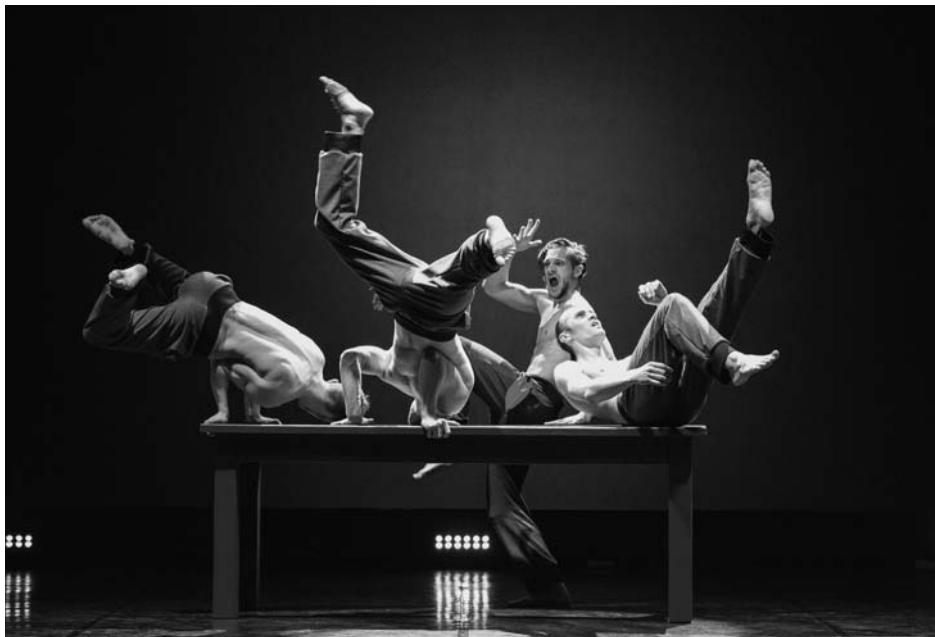
«Близость». Даугавпилс (Латвия)

клик на культовый фильм Джима Джармуша «Кофе и сигареты». Автор пьесы и режиссер Миа Княжевич . Это не ремейк фильма. Это спектакль, состоящий из отдельных сцен, открытый разговор со зрителями на очень личные темы — о страхах и надеждах европейцев, которым, оказывается, живется совсем не просто, правда, с кофе и сигаретой как-то легче. Много серьезных тем затронуто в диалогах героев, в том числе и иммиграция, тема для сербов большая. Спектакль очень простой, никаких технологических эффектов, все внимание на актерах. Какие же они мастера диалога, эти сербские артисты. Как интересно было следить за их общением — кажется, ничего не играют, просто разговаривают, пьют кофе, курят, но сколько за этим горестей и радостей, разные человеческие судьбы и характеры.