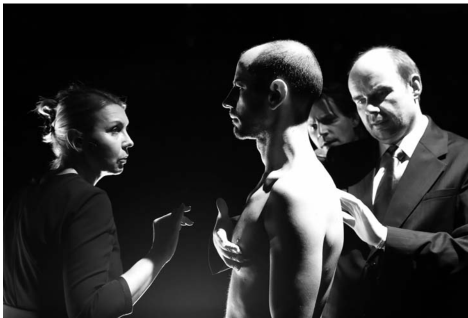
«Клоп». Авторский проект Е. Лоренци, Словения