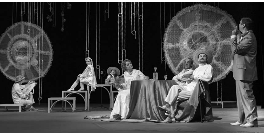
«Темные аллеи». Сцена из спектакля

врочем, никогда не живет отдельно от человека. И всегда есть некая золотая нить, некий пульсирующий нерв, пронзительный луч, на который наизано повествование чужой-своей жизни. Любовь в квадрате, печаль в кубе, страдание в превосходной степени. Трудно определить феномен Бунина. Нужно читать книгу или смотреть новый спектакль, совершенно открывшись чувству.