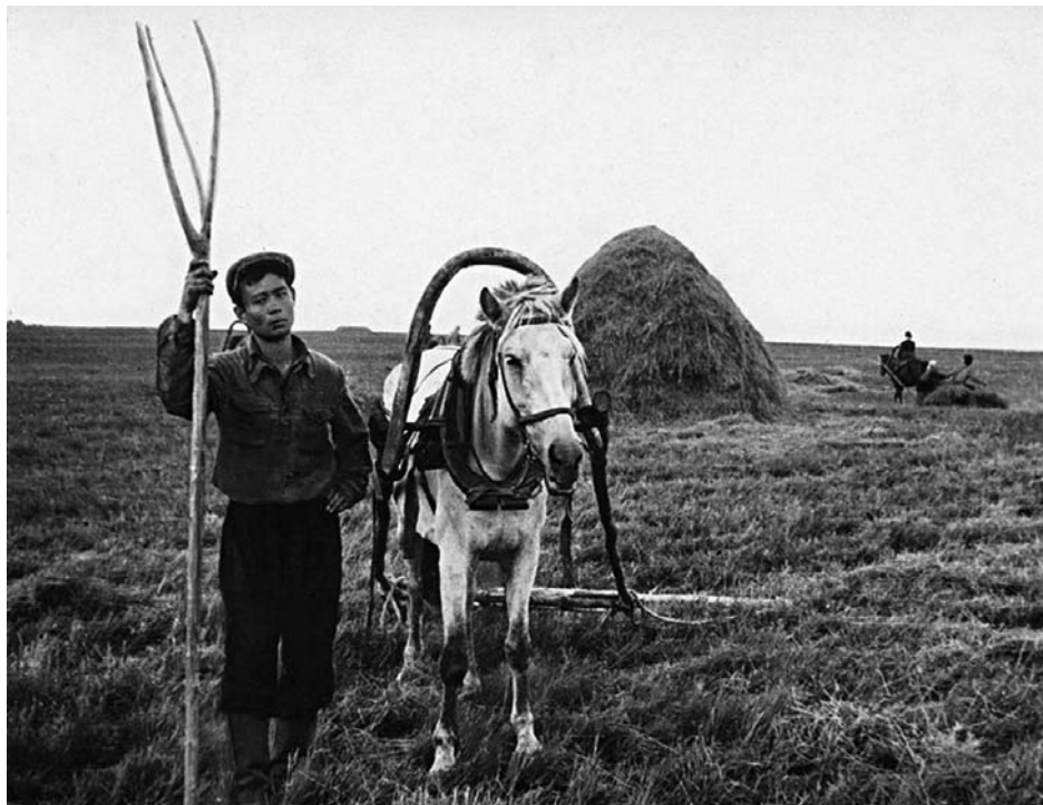
В сентябре каждого учебного года студенты Иркутского университета работали на полях Аларского, родного для Александра, района области. Здесь Вампилов и сфотографировался.

тижения человеческой души, неожиданными, часто трудно объяснимыми поворотами в поведении героев, властным, в немалой степени трагическим вторжением непредвиденных обстоятельств и случайностей в человеческую жизнь. Яснополянский мудрец был близок неустанным поиском добра и света в земном бытии, тем воскресением для праведности, которое, по убеждению Толстого, было доступно каждому человеку, и падшему, и вскормившему свою гордыню. Это капитальное качество Вампилова-художника пока не раскрыто его многочисленными толкователями, озабоченными порою лишь тем, как бы найти еще одно внешнее совпадение в текстах пьес драматурга и сочинений его великих предшественников.