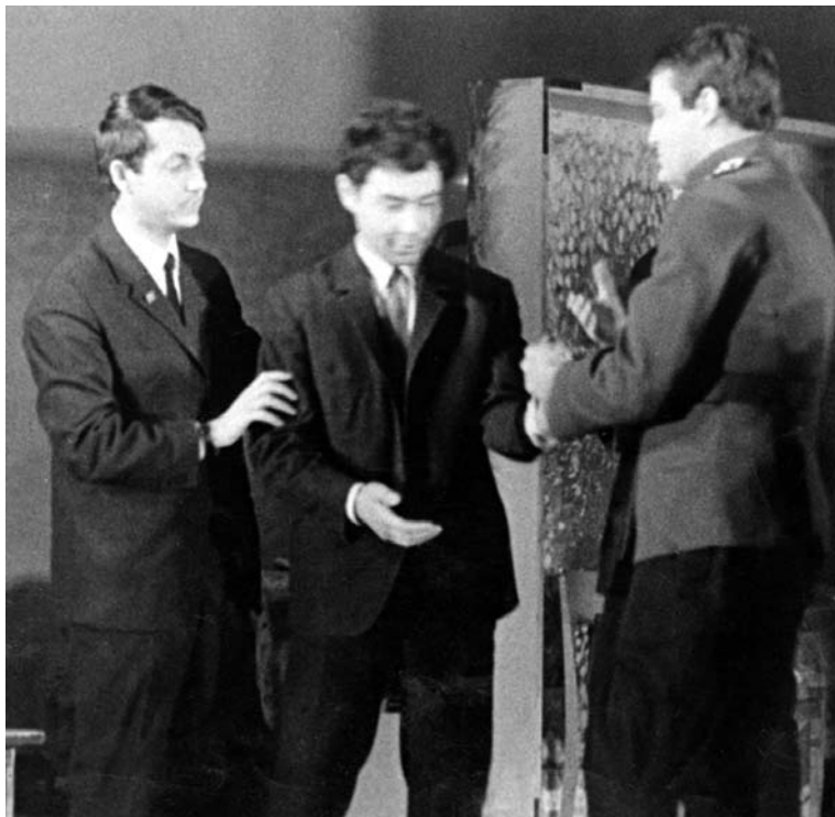
На премьерe спектакля «Старший сын» в Иркутском драматическом театре им. Н. Охлопкова (19 ноября 1969). Режиссер спектакля В. Симановский (на снимке слева) приглашает стеснительного автора выйти на сцену для поклона.

кого предела, великодушного всегда, когда нужно помочь сирому, явил нам из гущи бытия зоркий писатель!