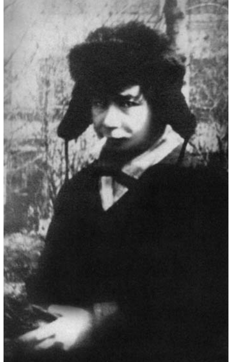
Александр Вампилов в последний год жизни. Весна 1972