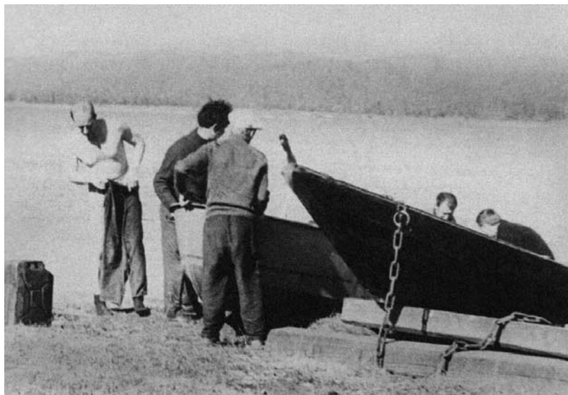
Вампилов на Байкале с гостями из журнала «Уральский следопыт»