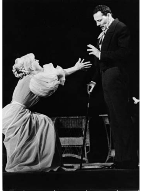
«Дама с камелиями». В роли Дюваля. ЦТСА

гами. Но, тем не менее, отдача Захарова каждой роли независимо от ее объема была абсолютной.