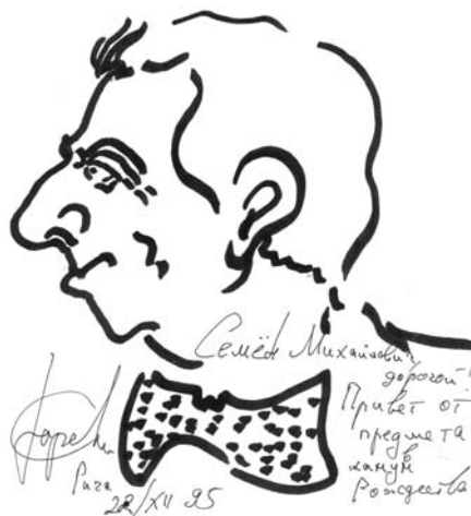
Сергей Юрьевич Юрский с автографом