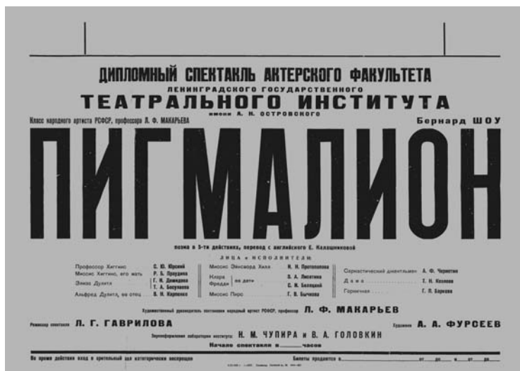
Афиша дипломного спектакля С. Юрского

свое учение о том, как сделать из себя артиста. Михаил Чехов был запрещен у нас. Но только теперь, когда он издан, понимаю, что и Товстоногов его тайно читал и кое-что давал нам в лекциях, а уж Юрский знал его от и до и впитал в себя как артист его метод. Юрский взял все от Чехова и сделал себя артистом такой высоты, к которой не знаю кто и когда сможет приблизиться. Это и замечательно, и опасно. С таким актером бояться работать режиссеру. Он приходит в работу с решением спектакля и своей роли в общем решении. Спорить с ним бесполезно. Или принимать все им предлагаемое или не брать его в работу. Такой актер-режиссер по сути обрекает себя на одиночество. И если он сам не находит для себя идеи, не создает театр вокруг себя, то пропадает. Чехов пропал, вне России, без своего зрителя, ему трудно было не пропасть, хотя в России Михаила Чехова мгновенно уничтожили бы, как класс. Не пропал Сергей Юрьевич Юрский. Ни в одну из эпох!