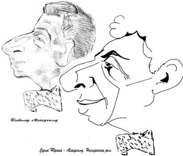
С. Юрский и Вс. Мейерхольд

фессия уведет Юрского в рационализм. Он потеряет артистическую непосредственность. Но продолжал разрешать заниматься режиссурой. И Юрский поставил выдающийся спектакль — булгаковского «Мольера». Товстоногову нашептывали: «Георгий Александрович, а разве могут быть в одном театре два театра?» В чем-то Товстоногов был согласен. И в то же время считал режиссуру Юрского, как он сказал на встрече со зрителями, «дуновением свежего ветра», то есть явным признаком одаренности.