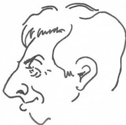
Сергей Юрский — Остап Бендер