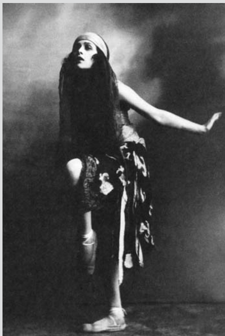
Танец «Айша». 1920-е