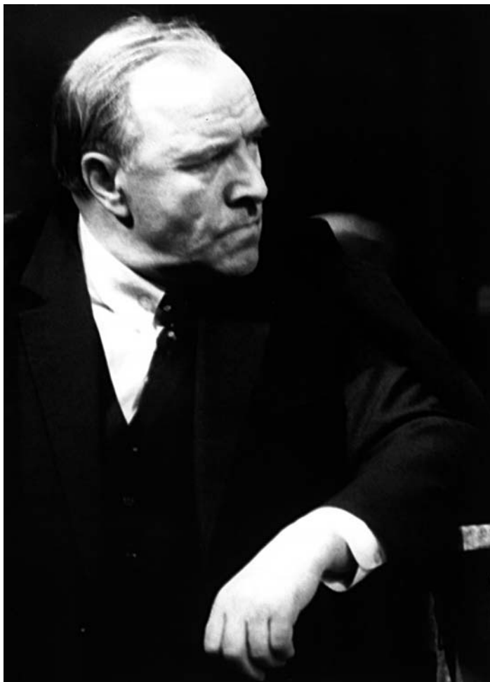
«Брестский мир». Ленин

«Бег» — блестящем соединении невероятной энергетики, простодушия, силы и наивности. И тонким психологическим рисунком роли отставленного от должности Абрикосова , крупного руководителя, ставшего простым пенсионером (« Частная жизнь »). Эта работа завоевала международное признание. На 39-м Венецианском кинофестивале Михаил Ульянов удостоился специального приза жюри. Достоверным, трогательным, мудрым Тевье-молочником . А был еще мощный Дмитрий Кармазов Достоевского и Понтий Пилат в « Мастере и Мар-