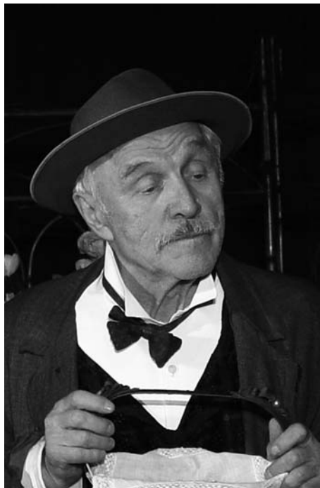
«Без вины виноватые». Шмага

гий, а потому что так Надо, потому что есть закон жизни, что кто-то должен, и этот долг перед обществом его герои воспринимали как лично к ним обращенный призыв.