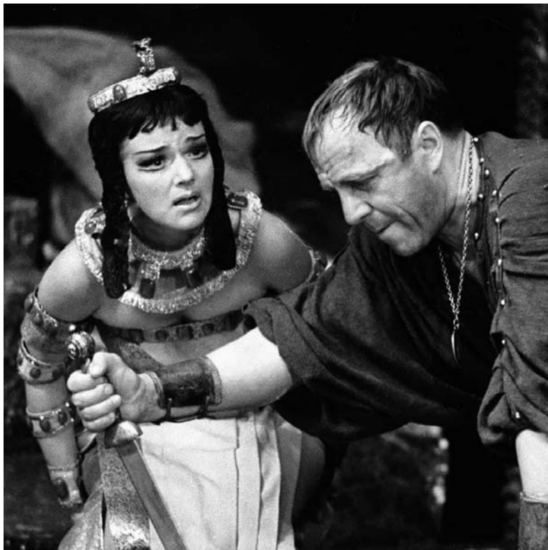
«Антоний и Клеопатра». Марк Антоний. Клеопатра — Ю. Борисова

ментом в деле защиты профессиональных интересов театрального сообщества.