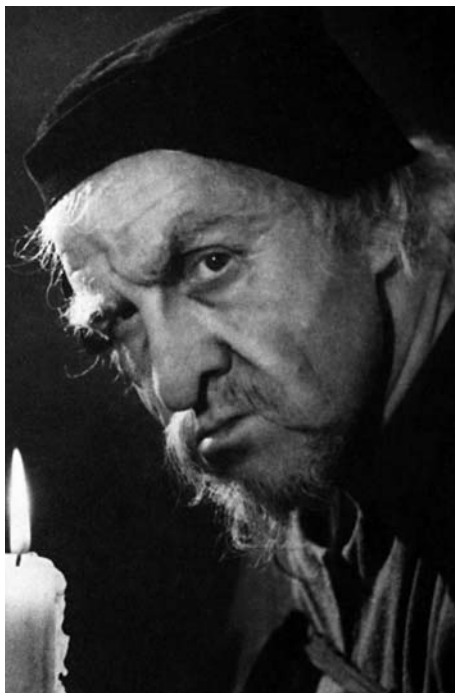
«Маленькие трагедии». Скупой рыцарь